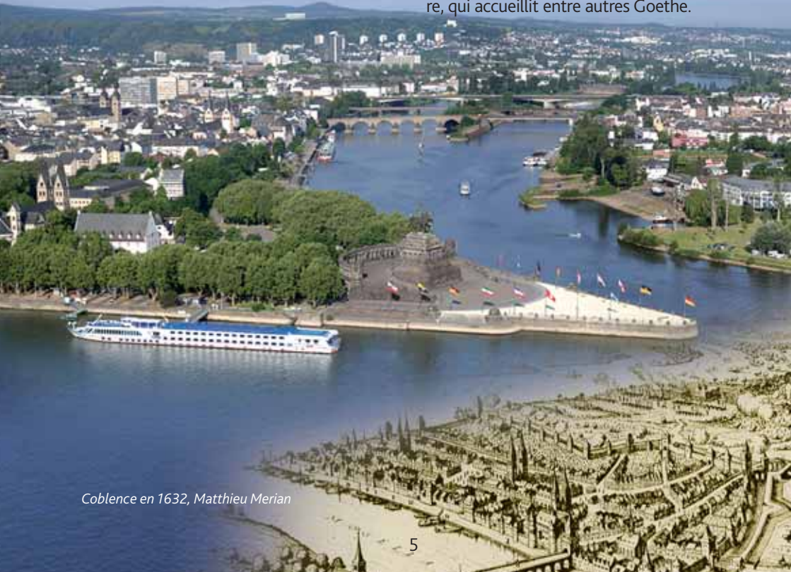
Coblençe en 1632, Matthieu Merian

Le 18ème siècle connut un nouvel essor des activités de construction : le prince électeur François-Georges, de la famille von Schönborn passionnée d'architecture, fit construire un pavillon de chasse selon des plans de Balthasar Neumann et agrandir la résidence. Mais ce projet n'était pas encore à la mesure des ambitions représentatives et administratives du dernier prince électeur de Trèves. Clément Wenceslas de Saxe décida de transférer la résidence d'Ehrenbreitstein vers Coblençe. Les fortifications urbaines au sud de la ville durent être abattues pour construire le nouveau château de résidence sur la rive du Rhin. Grâce à ce projet, de nouveaux espaces furent créés non seulement pour le château, mais aussi pour l'élargissement de la ville avec les nouveaux quartiers. C'est le chancelier de La Roche qui présidait la commission chargée des travaux, son épouse Sophie (1730-1807) est considérée comme la fondatrice du roman féminin allemand et tenait un salon littéraire, qui accueillit entre autres Goethe.