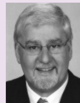
Joachim Mertes Präsident des Landtags Rheinland-Pfalz

Aus der Vergangenheit zu lernen, sich mit der Gegenwart zu beschäftigen und die Zukunft mit zu gestalten, dazu bieten Euch die drei Themen des Schüler- und Jugendwettbewerbs wieder Gelegenheit: Mitgedacht – mitgemacht! Wir freuen uns auf Eure Beiträge.