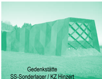
Gedenkstätte SS-Sonderlager / KZ Hinzert