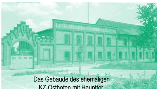
Das Gebäude des ehemaligen KZ-Osthofen mit Haupttor.

Uwe Bader, Referatsleiter II der Landeszentrale für politische Bildung Rheinland-Pfalz