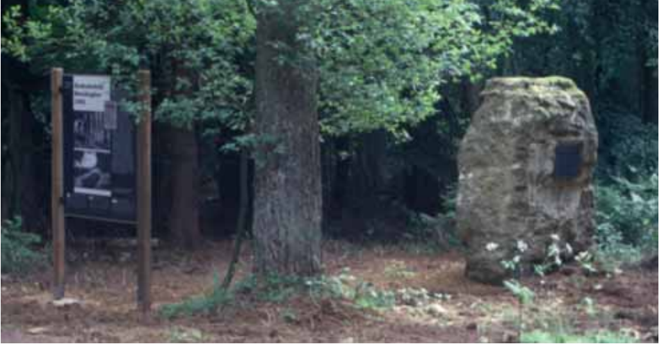
Gedenksteen voor de in 1942 vermoorde deelnemers van de Luxemburgse algemene staking.

onderzoeksgegevens zouden daarom niet aan het Openbaar Ministerie worden doorgegeven en de doodsvonnissen zouden tot 25 worden gereduceerd. Deze overeenkomst werd aan het Reichssicherheitshauptamt (het hoofdkwartier van de Inlichtingendienst) in Berlijn voorgelegd, waar