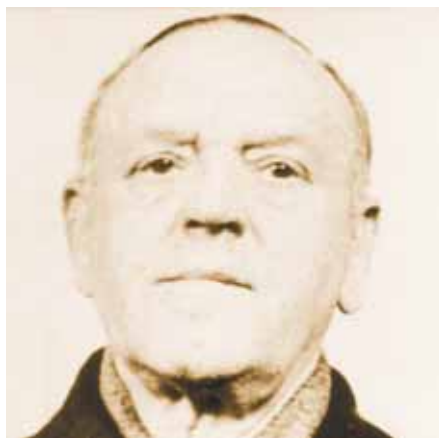
Kampcommandant Hermann Pister na zijn arrestatie.

opgericht als Polizeihaftlager (kamp voor gevangenen van de politie), dan als Arbeitserziehungslager (werk-heropvoedingskamp) gebruikt voor de aan de Westwall ingezette, in nationaal-socialistisch opzicht schuldig geworden werklieden van de Organisation Todt (OT) . Tijdens de Tweede Wereldoorlog ontwikkelde het zich tot een concentratiekamp voor gedeporteerden uit talrijke landen die door het Duitse leger bezet waren. Op grond van de verschillende speciale functies die het kamp in de loop van de tijd had, bleef het bij de benaming „SS-Sonderlager“ (speciaal SS-kamp), alhoewel het door het Wirtschafts- und Verwaltungsamt vanaf 1942 als een concentratiekamp