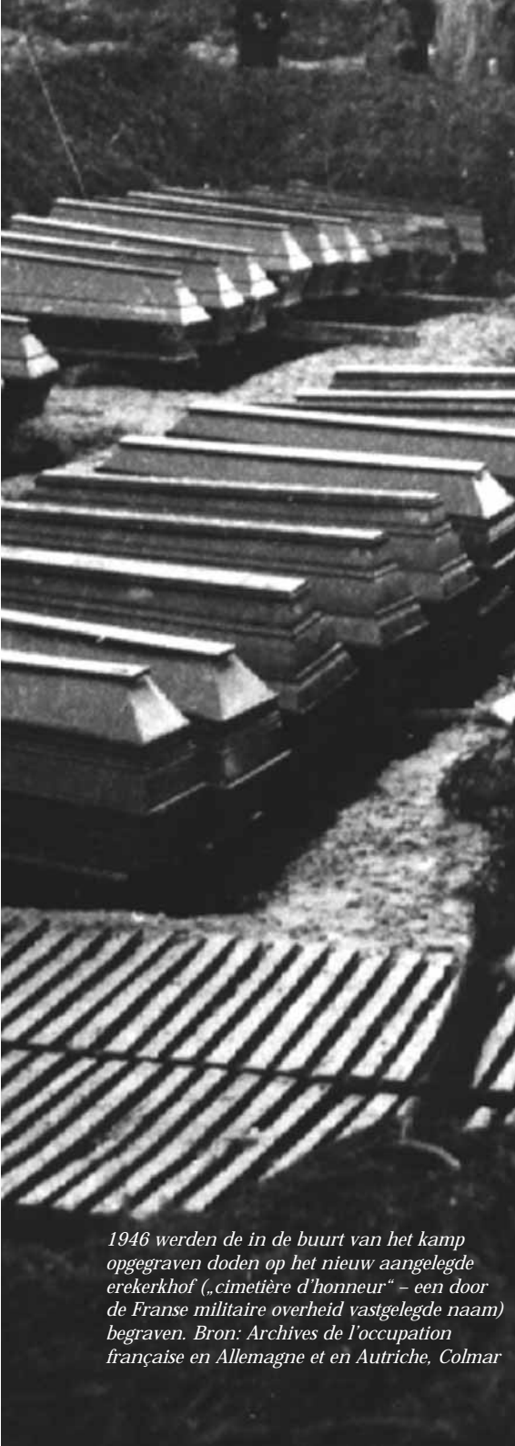
1946 werden de in de buurt van het kamp opgegraven doden op het nieuw aangelegde erekerkhof („cimetière d'honneur“ – een door de Franse militaire overheid vastgelegde naam) begraven.

reden daarvoor was het zogenoemde Kommissar -bevel. Volgens dit bevel van Hitler zouden politieke functionarissen ( Kommissare ), die in het leger van de Sovjetunie voor de communistische scholing van de soldaten verantwoordelijk waren na hun gevangenneming worden vermoord. Twee vrachtwagens brachten de 70 krijgsgevangenen na het vallen van de nacht naar het speciaal SS-kamp / concentratiekamp Hinzert. De argeloze soldaten spiegelde men voor, dat zij voor een nieuwe tewerkstelling een medisch onderzoek moesten ondergaan en gevaccineerd zouden worden. Zij werden een voor een naar de quarantaine-barak gebracht waar zij echter met een dodelijke cyaankali-injectie om het leven werden gebracht. Nog diezelfde nacht werden de vermoorde soldaten in de reeds gegraven massagraven gedumpt die ergens in het bos verborgen lagen.