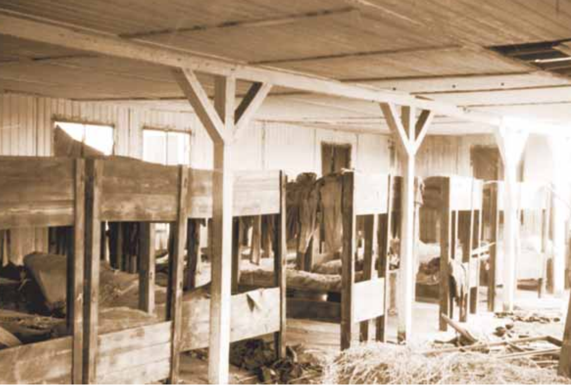
Zicht op een lege barak van het kamp, maart 1946.