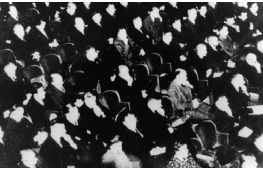
Blick in die Beratende Landesversammlung

Im August 1946 verfügte Frankreich die Errichtung eines politischen Gebildes, nämlich eines „rheinpfälzischen Landes“, das die Pfalz, die Regierungsbezirke Trier, Koblenz, Mainz und Montabaur umfassen sollte. Der Auftrag der Beratenden Landesversammlung, die am 22. November 1946 im Koblenzer Stadttheater erstmals zusammentrat,